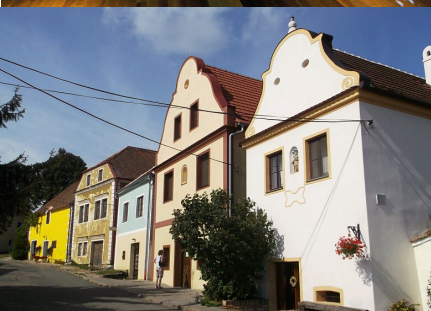
Sklepní ulička Česká, Pavlov