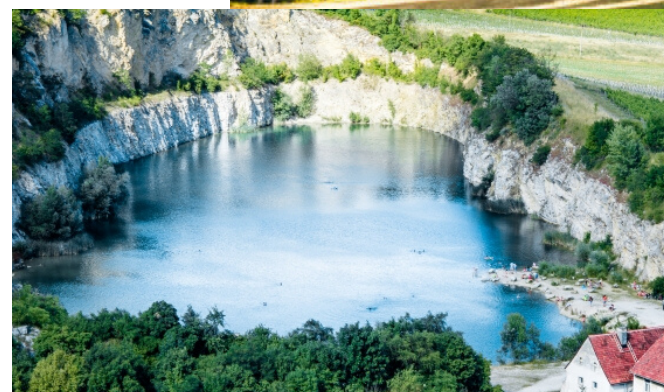
Vápencový lom Mikulov