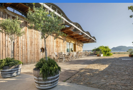
Vinařství Sonberk Popice